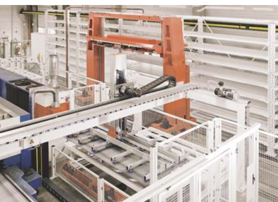
4 Materialübernahme und -bereitstellung durch ein Handlingportal

Das Warehouse Management System wurde auf der Basis des Open-Source-Rahmenwerks myWMS® in einer Schichtenarchitektur umgesetzt. Die Software ist modular aufgebaut und weitgehend parametrierbar und kann dadurch einfach und schnell an die jeweiligen Prozesse und Systeme des Kunden angepasst werden. Es verwaltet den gesamten Lagerbestand sowie die Lagerorte jeder einzelnen Blechtafel – auch innerhalb eines gemischten Stapels – und beauftragt darüber hinaus mithilfe der integrierten Materialflusssteuerung auch die Bewegungen der für das vor- und nachgelagerte Handling der Bleche eingesetzten auto-