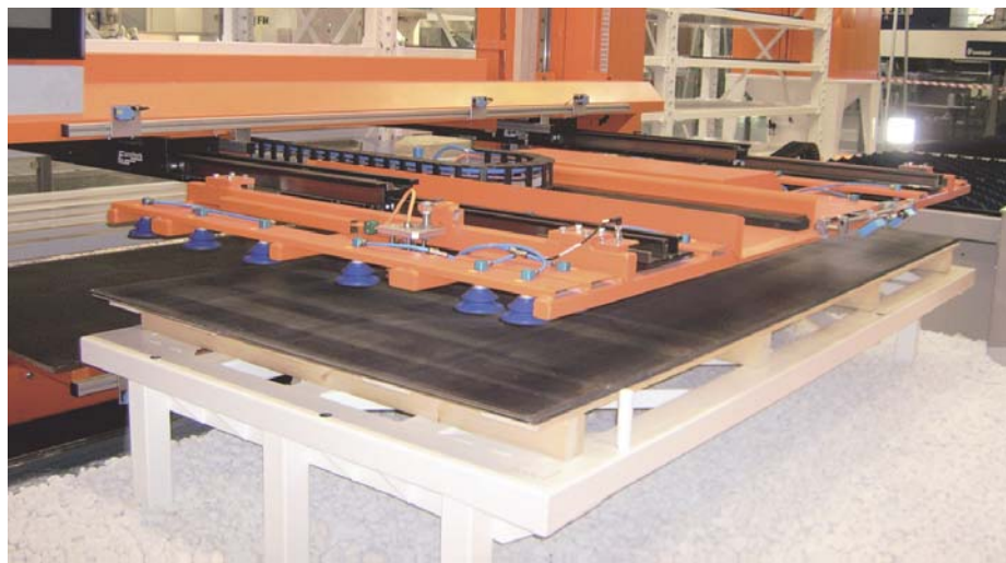
2 Regalbediengerät mit sehr flach bauendem Vakuum-Sauggreifer

dieser Technik liegt ganz offensichtlich darin, dass jeweils eine komplette Schublade aus dem Regal herausgenommen und zu einem Entladeplatz gefördert werden muss, auch wenn dort nur eine einzelne Blechtafel entnommen werden soll. Damit ist auch das vor oder in dem Regalsystem arbeitende Handlinggerät für solche Schubladen eine entsprechend große, schwere und mit leistungsstarken Antrie-