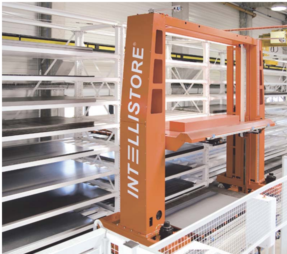
1 Intellistore® – das innovative Lagersystem für Blechtafeln

Metall verarbeitende Betriebe nutzen in der ersten Blechbearbeitungsstufe zunehmend automatisierte Maschinen, z. B. Laser- bzw. Plasmaschneidanlagen oder Stanzmaschinen. Bereits bei einem kleinen bis mittleren Verbrauch (rd. 3 bis 20 Tafeln pro Stunde) von Blechen verschiedener Abmessungen und unterschiedlicher Materialbeschaffenheit bietet es sich zur Optimierung des gesamten Produktionsprozesses an, auch das Lagersystem für die Blechtafeln sowie die Zuführung der einzelnen Bleche zu den Bearbeitungsmaschinen zu automatisieren. Bei den bisher am Markt angebotenen Lösungen werden die zu bearbeitenden Blechtafeln in Hochregallagern mit der sog. Schubladen- oder Kassettenteknik bevorratet. Unter „Schubladen“ sind in diesem Zusammenhang die Ladehilfsmittel zu verstehen, die – jeweils sortenrein mit Blechtafeln gefüllt – in den Fächern eines Hochregals eingelagert sind. Wegen des relativ hohen Lastgewichts – üblich ist die Anlieferung und Einlagerung von Blechpaketen mit Gewichten von etwa 2 bis 3 t – werden die Schubladen entsprechend massiv ausgeführt, was wiederum zu einem hohen Eigen- oder Leergewicht dieser Ladehilfsmittel führt. Demzufolge fällt auch der Stahlbau des gesamten Regalsystems sehr gewichtig aus. Der entscheidende Nachteil